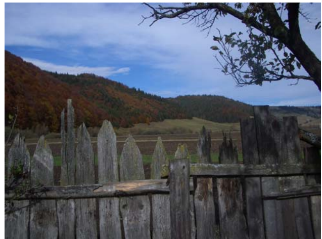
Eine Landschaft für den Kalender