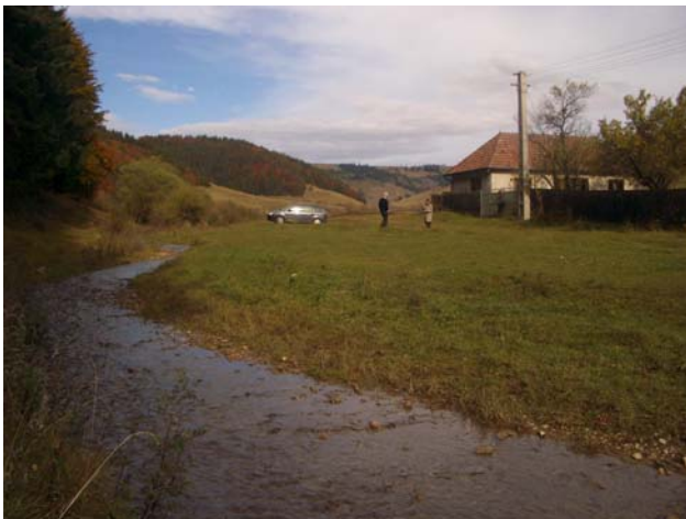
Ein Bächlein gleich neben dem Haus