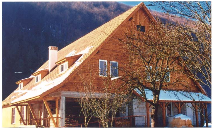
Das Haus ist wintersicher vor dem ersten Schnee