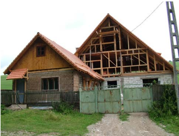
Das kann sich sehen lassen