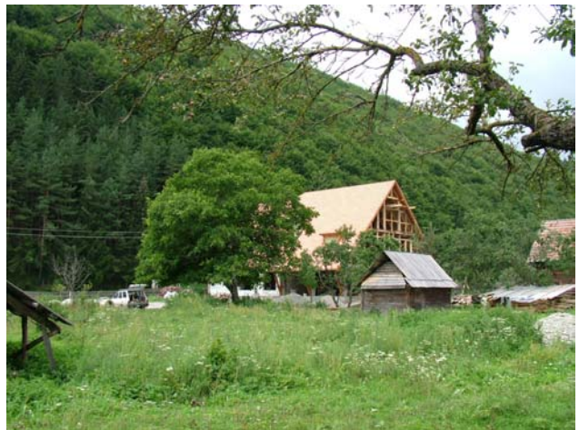
Der grosse Umschwung für ein Zeltlager