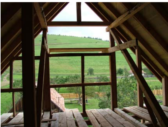
Der Ausblick vom Dachstock