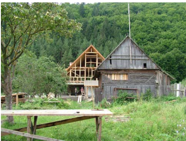
Aus Alt wird Neu