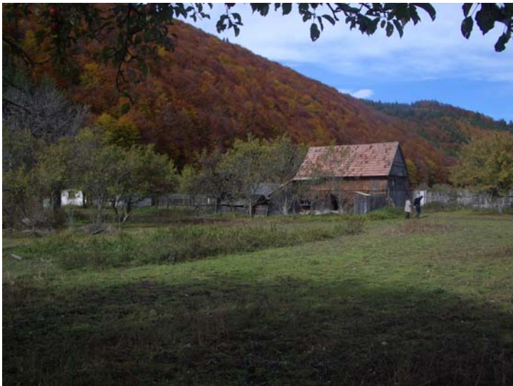
Ein grosses Grundstück mit alten Gebäuden