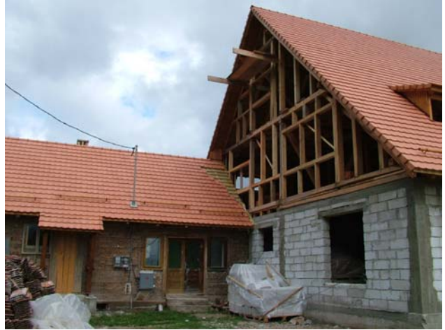
Alt und Neu miteinander verbunden