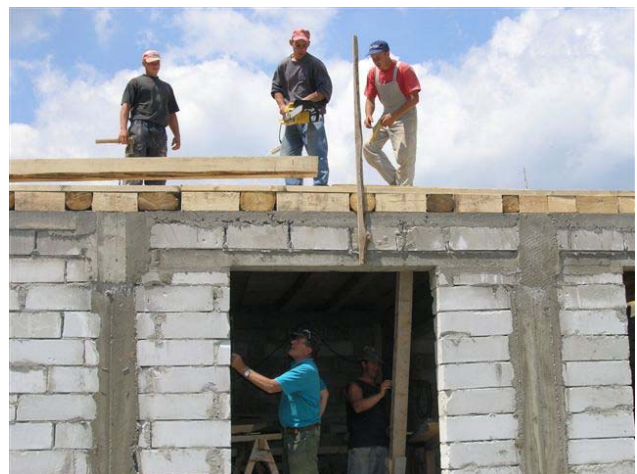
Die Arbeit geht zügig voran