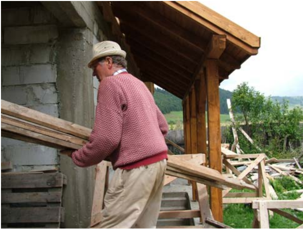
Auch der Chef packt an